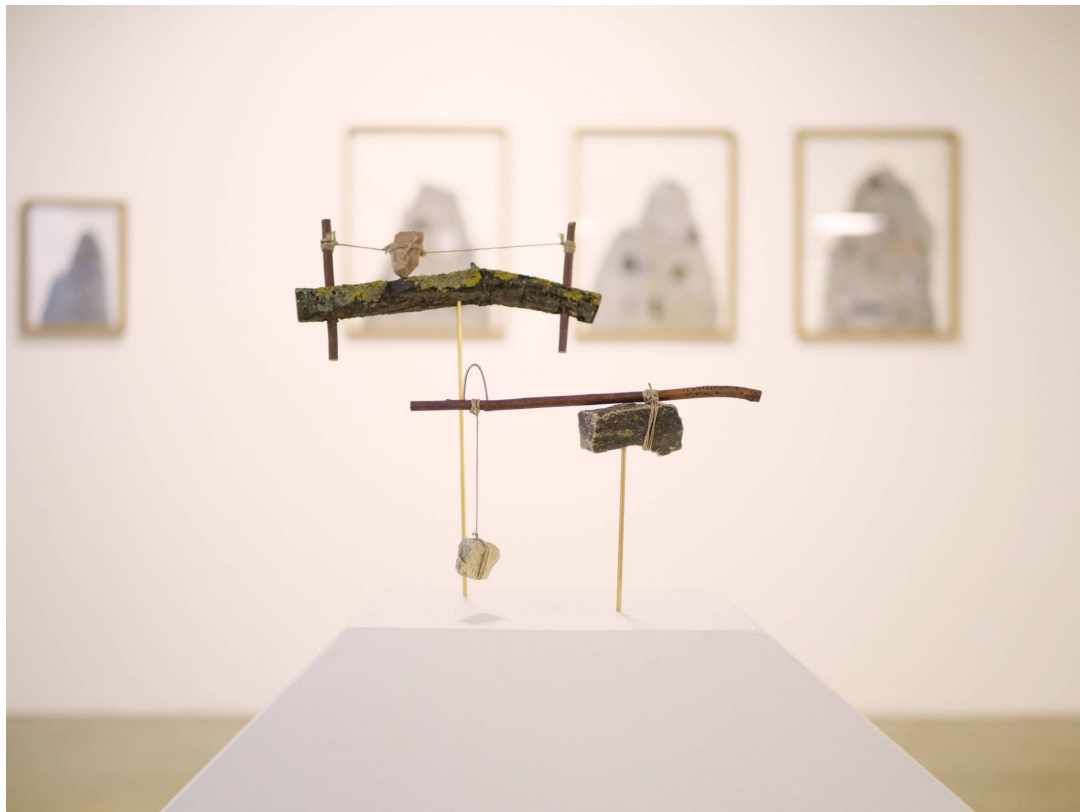
Gabrielle Manglou, Délicatolitho , Lyon, 2021 au CAP Saint-Fons