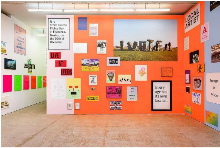
Vues d'exposition, Jeremy Deller, Warning Graphic Content , The Modern Institute, Aird's Lane, Glasgow, 2021 Photo: Patrick Jameson. Courtesy de l'artiste ; Art : Concept, Paris & The Modern Institute/Toby Webster Ltd, Glasgow