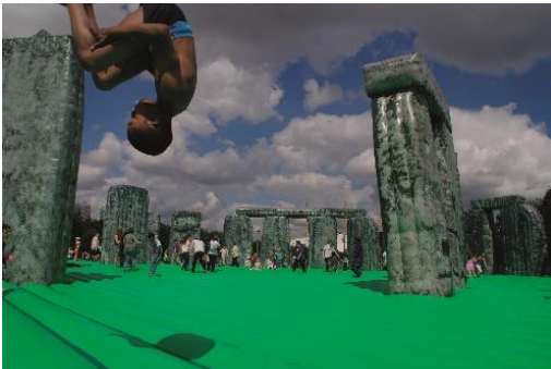
Jeremy Deller, Sacrilege , 2012, installation view Greenwich, London/UK - Photo by Jeremy Deller Courtesy de artiste; The Modern Institute / Toby Webster LTD, Glasgow; Art : Concept, Paris