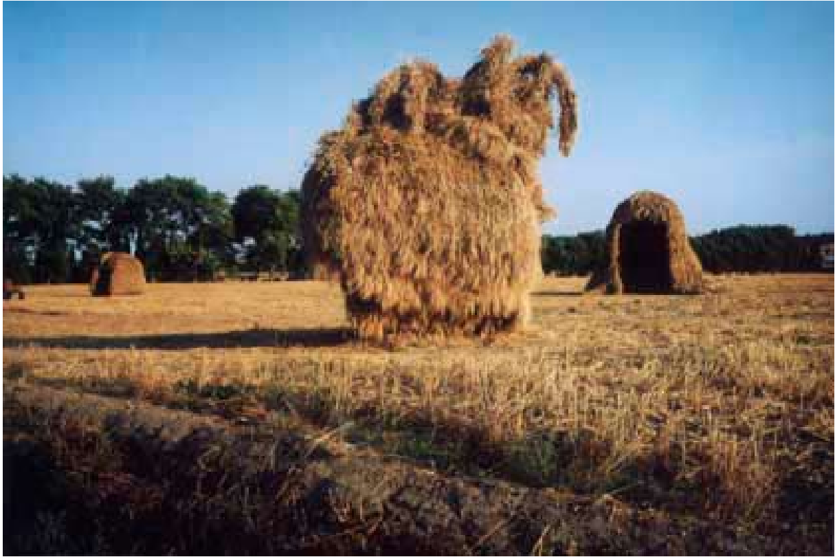
Alexandre Perigot, Blondasses , vidéo, 2002. Courtesy Galerie Maisonneuve, Paris